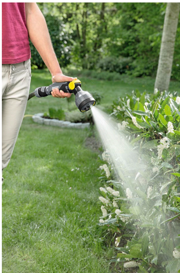
Металлический многофункциональный поливочный пистолет